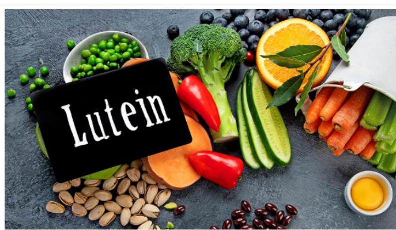
Optimering og bioraffinering af lutein fra mikroalger