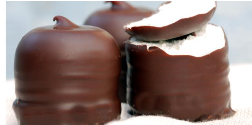
New and innovative foam kiss