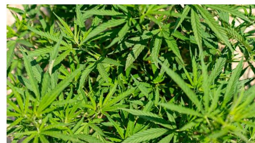
Biobaserede bindere til hampekompositter